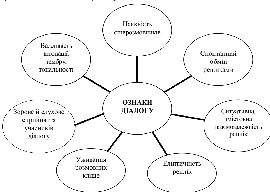
Рис. 1. Ознаки діалогу

Передусім вважаємо доцільним з'ясувати сутність поняття “діалогічне мовлення”. Цей феномен у методиці навчання ІМ прийнято трактувати як процес мовленнєвої взаємодії двох або більше учасників спілкування. При цьому кожен із учасників по черзі виступає як мовець (ініціатор спілкування – адресант) і як слухач (партнер по спілкуванню – адресат) (Бігич, Бориско, та ін., 2013, с. 302). Безперечно, цінність ДМ, передусім, полягає в результаті, якого досягають комуніканти. Отже, діалог є формою говоріння, в процесі якої відбувається безпосередній обмін взаємопов'язаними й взаємозумовленими висловлюваннями. Докладніше зупинимось на ознаках діалогу (див. рис. 1).