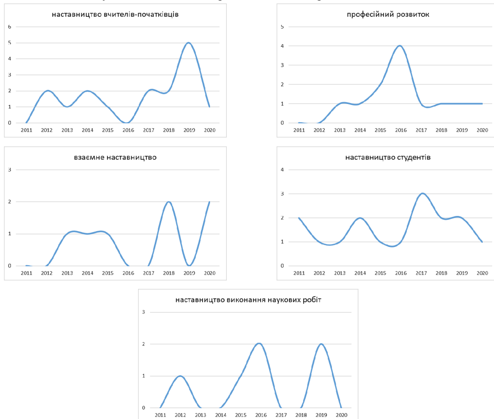
Рис. 2. Динаміка кількості публікацій за категоріями у межах теми “Наставництво”

З огляду на порівняно невеликий обсяг аналізованої бази важко робити статистично значущі узагальнення. Проте помітна загальна тенденція щодо деякого збільшення цікавості до теми наставництва, починаючи з середини останнього десятиліття. Нижче подано переліки та загальний огляд публікацій згідно з окресленими категоріями.